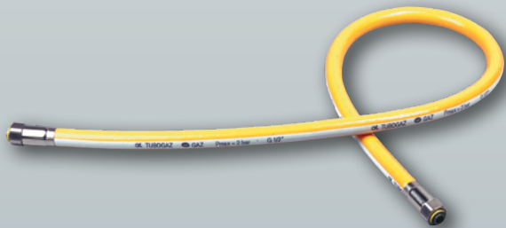
TUBOGAZ® - DN 1/2"