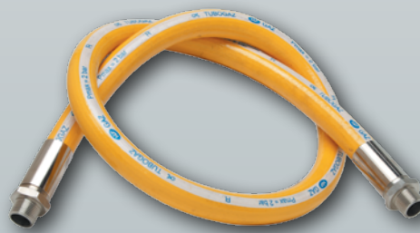
TUBOGAZ® - DN 3/4"