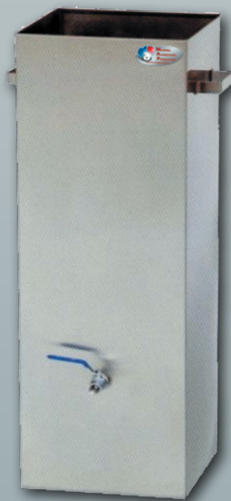
Cuve de trempage pour broches Idéal pour nettoyer broches et déflecteurs.

Cuve de trempage pour broches (300 x 300 x 990 m m)