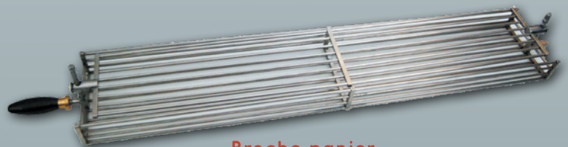
Broche panier SpidoFix® Ultra rapide et maniable. BREVET M.A.P.