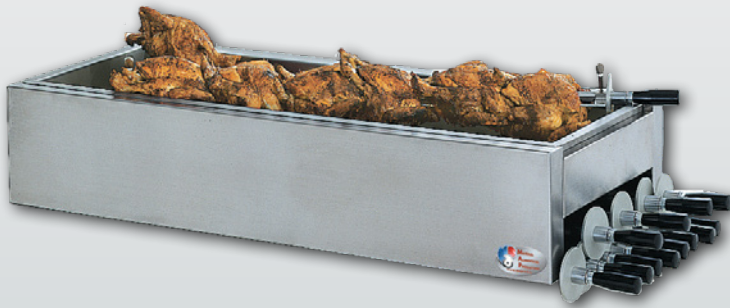
Plateau de débroschage Idéal pour le débroschage des cuissons