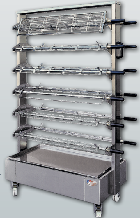
Rack à broches sur roulettes D'une capacité de 12 broches, ce rack est idéal pour stocker les préparations en chambre froide.