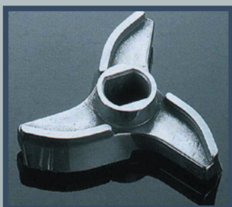
Couteau auto affûtant