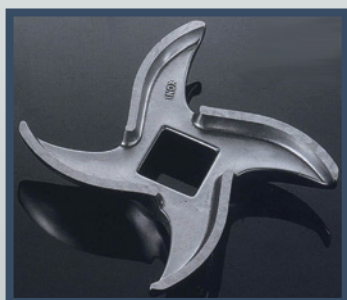
Couteau Simple Coupe