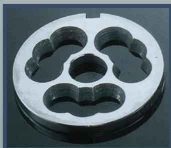
Grille de précoupe inclinée "00"