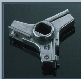
Couteau à lamelles