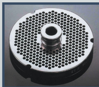
Exemple de grille ENTERPRISE