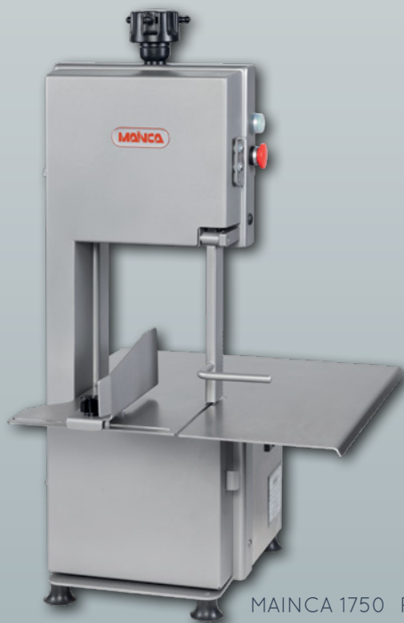
MAINCA 1750 P