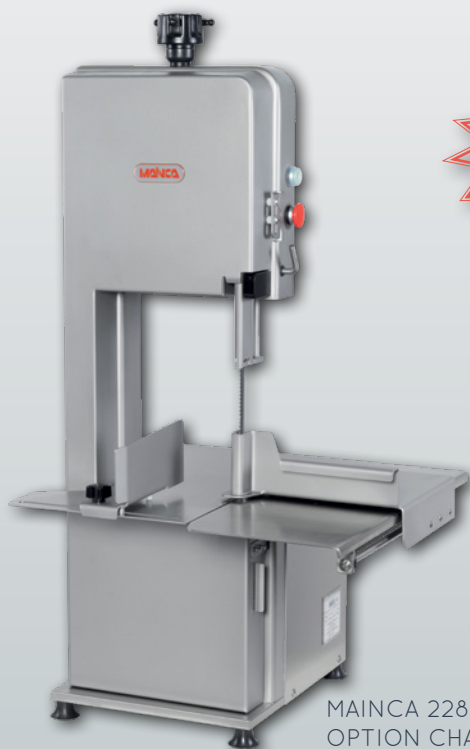
MAINCA 2280 P OPTION CHARIOT COULISSANT