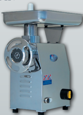
TC 22 X