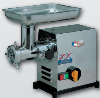
TC 12 P / TC 22 P