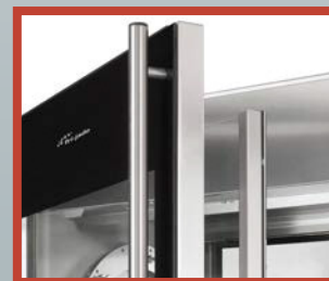
PORTES DOUBLE VITRAGE