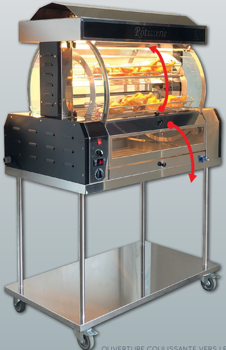
OUVERTURE COULISSANTE VERS LE HAUT ET PIVOTANTE VERS LE BAS