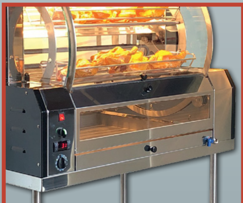
PLAT A POMMES DE TERRE INTEGRAL